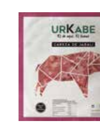
Cabeza de Jabalí loncheado Ref.: 354022 200 g. 12 u. Sobre 200 g.