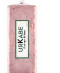
Jamón Cocido Extra 11x11 Ref.: 351010 3.000 g. 3 u. 14 x 5 u.