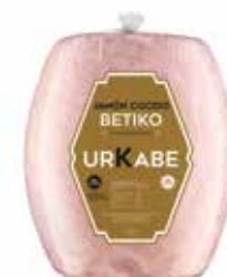
Jamón Cocido Betiko Ref.: 350100 7.300 g. 1 u. 14 x 5 u.