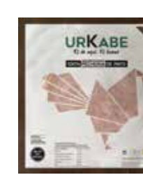
Pechuga de Pavo loncheado Ref.: 354024 200 g. 12 u. Sobre 200 g.