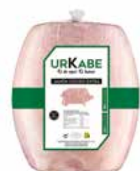
Jamón Artesano Ref.: 350000 7.300 g. 1 u. 14 x 5 u.