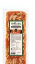
Callo Guisados Vizcaina 480 g. Ref.: 353064 480 g. 12 u. 10 x 10 u. Porción 480 g.