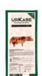
Callo Rojo 480 g. Ref.: 353002 480 g. 12 u. 10 x 10 u. Porción 480 g.