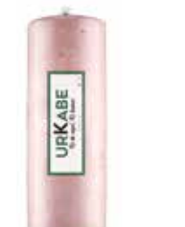
Jamón Cocido Extra Sandwich Ref.: 350016 3.000 g. 2 u. 6 x 10 u. Molde Entero