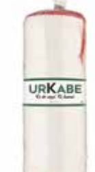
Cabeza de Jabalí Túnel Ref.: 354000 3.000 g. 3 u.