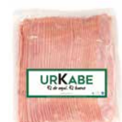
Bacon Cocido loncheado 2 mm. Ref.: 356060 1.000 g. 6 u. 15 x 6 u. Sobre 1.000 g.