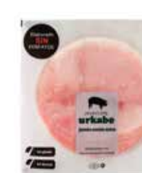
Jamón Sin Fostatos Ref.: 350540 150 g. 16 u. 14 x 10 u.