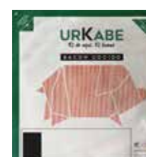
Bacon Cocido loncheado Ref.: 356002 200 g. 12 u. Sobre 200 g.