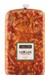
Callo Rojo bloque 6 Kg. Ref.: 353000 6.000 g. 1 u. 18 x 6 u. Bloque 6 Kg.