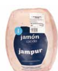
Jamón Cocido Jampur Ref.: 350040 7.300 g. 1 u. 14 x 5 u.