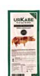
Callo Guisados Castellana 480 g. Ref.: 353201 480 g. 12 u. 10 x 10 u. Porción 480 g.