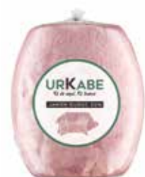
Jamón Duroc Ref.: 350040 7.300 g. 1 u. 14 x 5 u.