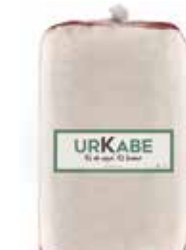
Cabeza de Jabalí Ref.: 354001 3.000 g. 1 u.