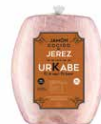
Jamón Cocido al Jerez Ref.: 350115 7.300 g. 1 u. 14 x 5 u.