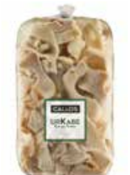
Callo Blanco bloque 6 Kg. Ref.: 353004 6.000 g. 1 u. 18 x 6 u. Bloque 6 Kg.