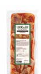
Morros Preparados Ref.: 353102 480 g. 12 u. 11 x 10 u. Porción 480 g.