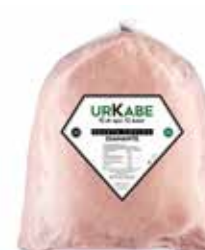
Paleta Diamante Ref.: 351007 4.000 g. 1 u. 11 x 7 u.