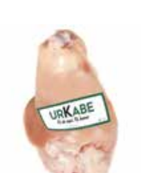
Centro Codillo Ref.: 356255 900 g. 10 u.