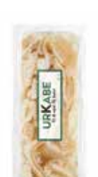
Callo Blanco 480 g. Ref.: 353006 480 g. 12 u. 10 x 10 u. Porción 480 g.