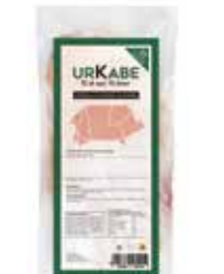
Codillo Cocido de Jamón c/piel Ref.: 356201 1.500 g. 7 u. 7 x 5 u.