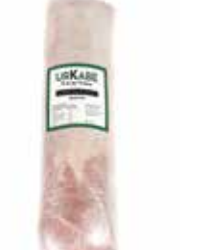
Lomo Ajillo Selección Ref.: 352016 3.500 g. 2 u. 7 x 10 u.