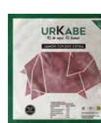
Jamón Artesano loncheado Ref.: 350530 200 g. 12 u. 14 x 10 u. Sobre 200 g.