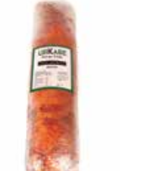
Lomo Adobado Selección Ref.: 352011 3.500 g. 2 u. 7 x 10 u.