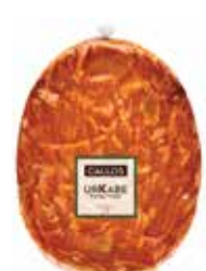
Callo Rojo bandeja 3 Kg. Ref.: 353001 3.000 g. 2 u. 11 x 7 u. Bandeja 3 Kg.